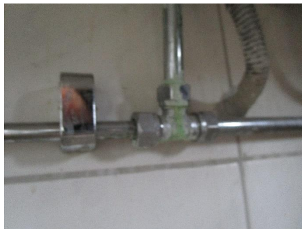
Korrosion på rörkopplingar i badrum