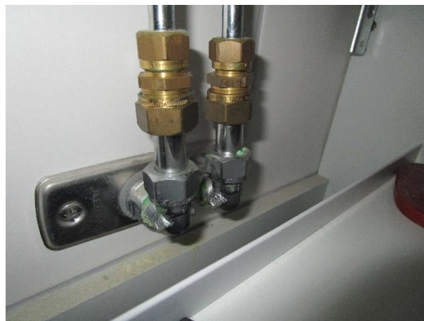
Korrosion på rörkopplingar vid handfat