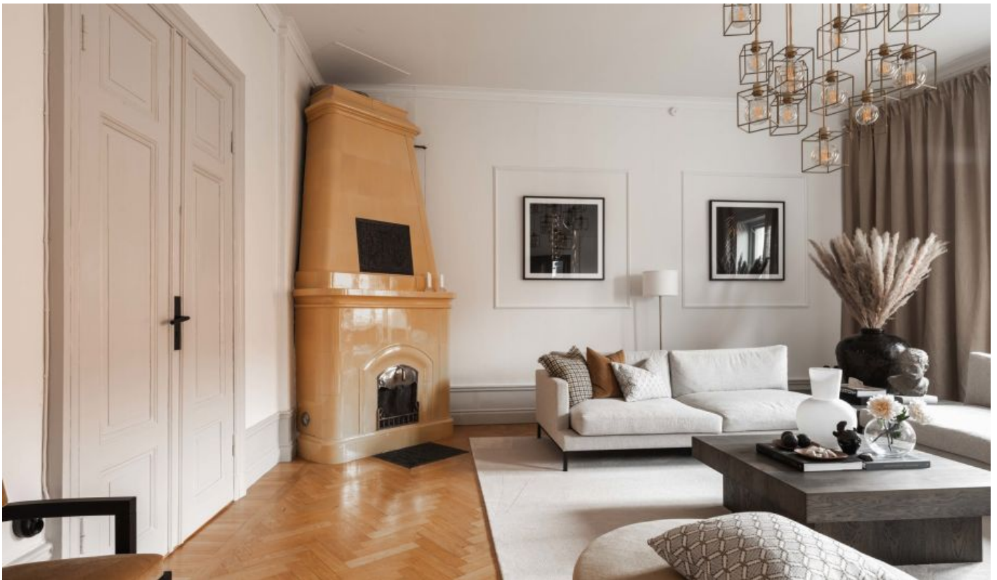
En fungerande kakelugn pryder det pampiga vardagsrummet