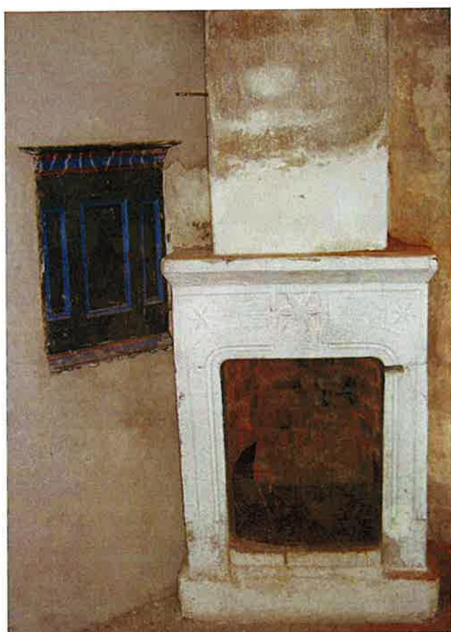
Den öppna spisen, med sandstensomfattning från 1781. T v syns det inmurade väggskåpet