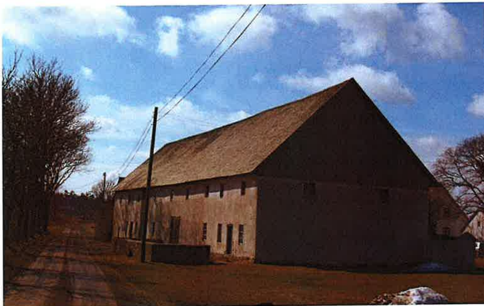
Ladugårdslängans baksida, med gödselstaden. Vägen till vänster leder vidare till Torsburgen

Ladugårdslängan är uppförd på 1870-talet, i sten under spåntak och är den största vid Hajdeby, ca 40 m lång och 10 m bred. I det undre planet finns framförallt fähus, men även tröskvandring m m. Övervåningen utgörs i helhet av ett storvulet foderloft. Byggnaden har restaurerats under 1900-talets sista årtionden för byggnadsvårdsmedel.