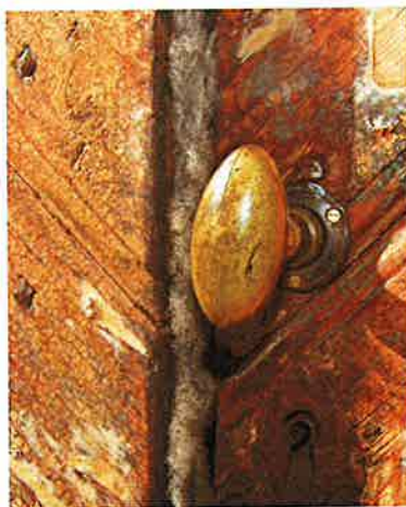
T v: Entrén, med den bevarade bröstmålningen som även finns på insidan. T h: Detalj av entrédörren.