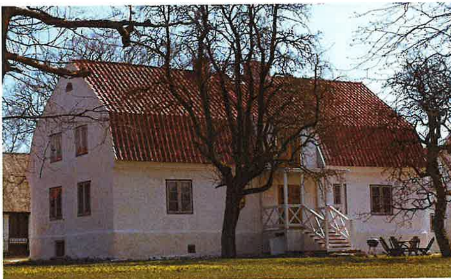
Baksidan, efter fasadrestaureringen.

Manbyggnaden är ursprungligen uppförd kring 1798 och om- och tillbyggd på 1840-talet. Huset är en parstuga i 1 ½ plan, på hög sockel med källare, under ett tegeltäckt mansardtak. Den något asymmetriska huvudfasaden tyder på att byggnaden har uppförts som enkelstuga och sedan, troligtvis kring 1800-talets mitt, förlängts till nuvarande storlek. Under takfoten löper en profilerad gesims, från 1800-talets andra hälft.