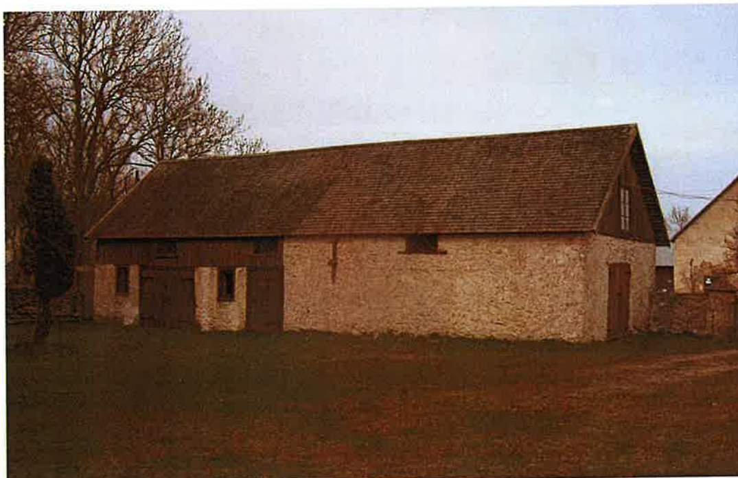
Ladugårdsflygelns gårdsfasad.

Den norra uthuslängan , även kallad magasinet eller oxhuset är storgårdens äldsta byggnad. Den har sitt ursprung i 1800-talets första hälft. Den äldsta, östra delen är byggd i sten och var ursprungligen ladugård, men har även brukats som vagnsbod.