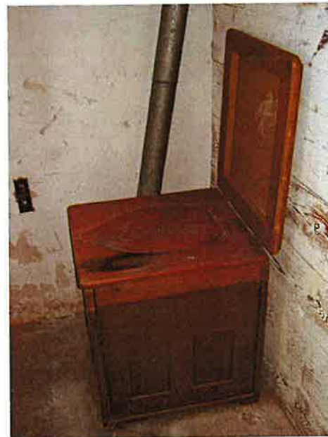
T v: Ytterdörren, med svajp och naror . T h: Bakom köket inreddes ett badrum, med badkar och ”modern” toalett.