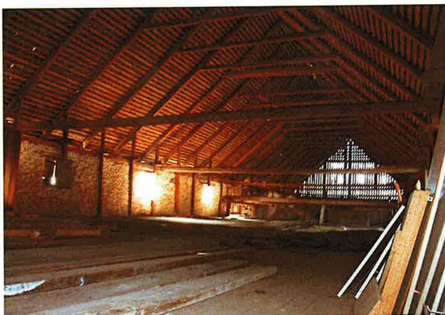
Del av det ovanligt omfångsrika foderloftet

Hela byggnaden är mycket välbevarad, med bibehållet murverk, oförändrad fasad, dörr- och fönstersättning, inredning och funktionsindelning, varsamt restaurerat till ursprungligt skick.