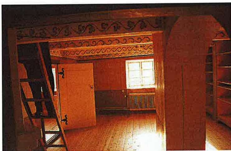
Biblioteket, med dess växtmålerier, som Nils Lithberg lät inreda på övervåningen. Th syns en del av de väggfasta bokhyllorna.