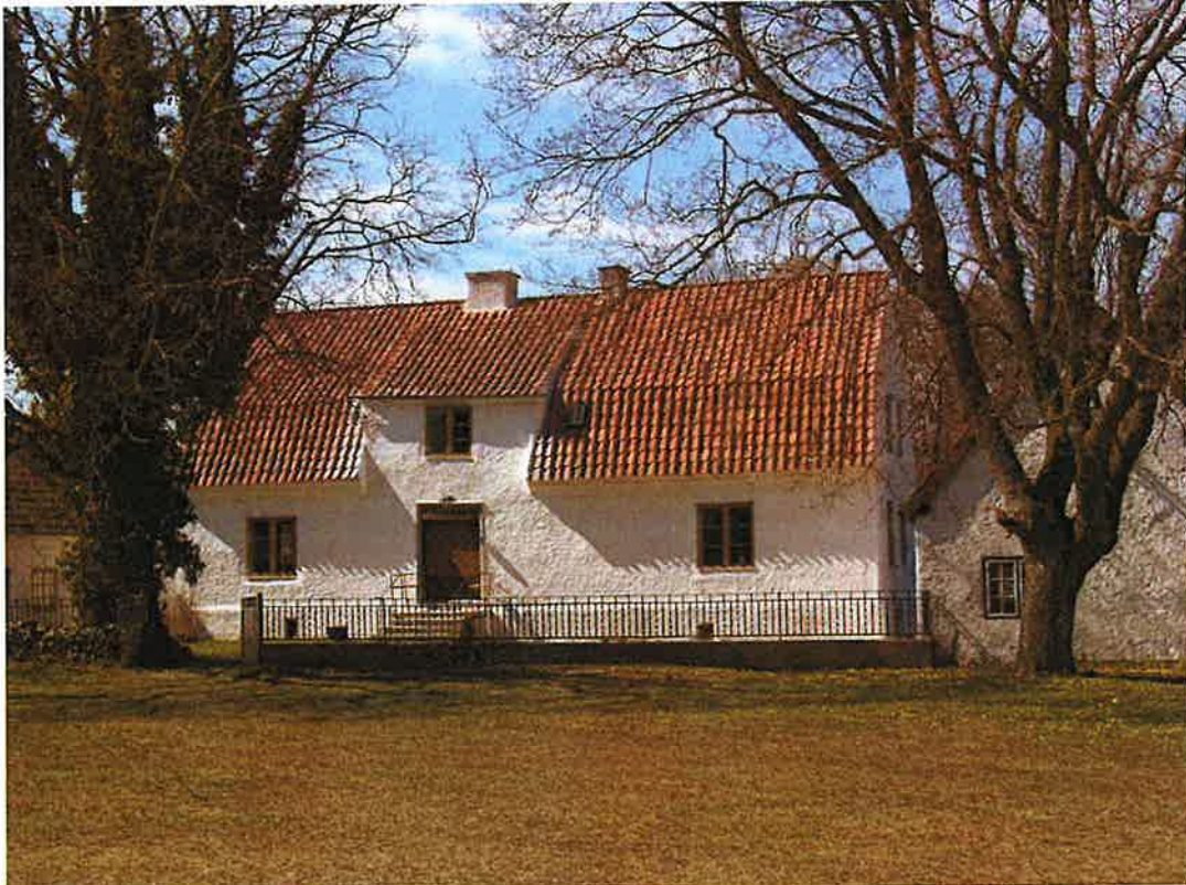
Manbyggnaden och norra flygeln vid "mellangården" på Hajdeby. Foto Leif Bertwig 2005

Länsmuseets dnr: AD-2005-0425 Peter Olsson 2005-05-09