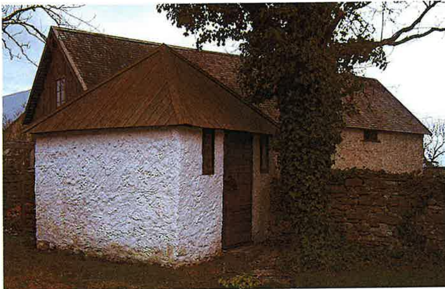
Herrskapsdasset. I bakgrunden syns Ladugårdsflygeln där tjänstefolkets dass fanns och fortfarande finns kvar.