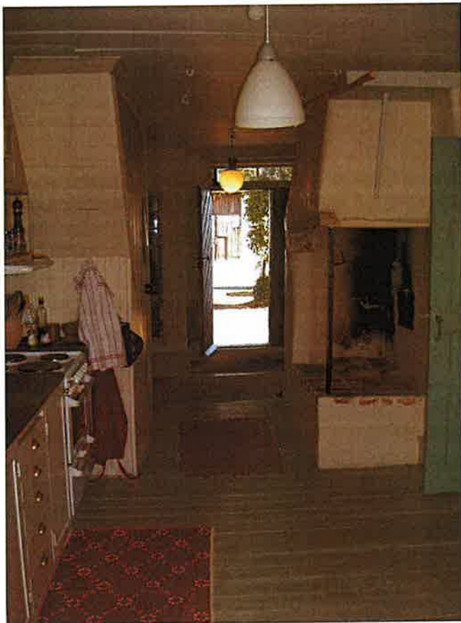
Från det nyligen iordningställda köket skymtar ladugården genom ytterdörren. Th syns en bevarad bakugn.

De nuvarande ägarna köpte gården 2000, utav Henning Österdahls dödsbo. De har under de senaste åren genomfört en rad restaureringar, huvudsakligen på manbyggnaden.