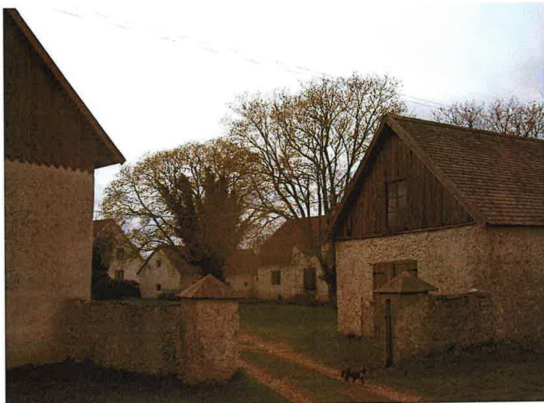
Den muromgärdade infarten till Hajdeby 1:15, mellan ladugården och ladugårdsflygeln.

Ekonomibyggnaderna ramar in den gräsbevuxna storgården som avgränsas mot lillgården av ett smidesstaket på gjuten sockel samt en kortare sträckning med kalkstensmur. Gårdsinfarten löper snett in från vägen i nordost, mellan ladugården och ladugårdsflygeln.