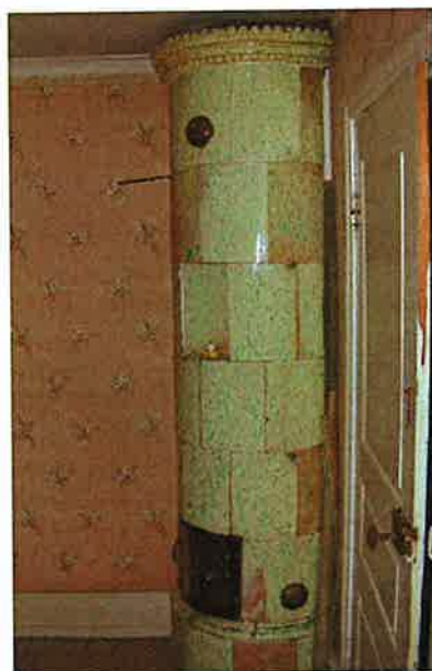
Två av kakelugnarna i manbyggnaden, båda från Bergs verkstad i Alva, tillverkade kring 1840.