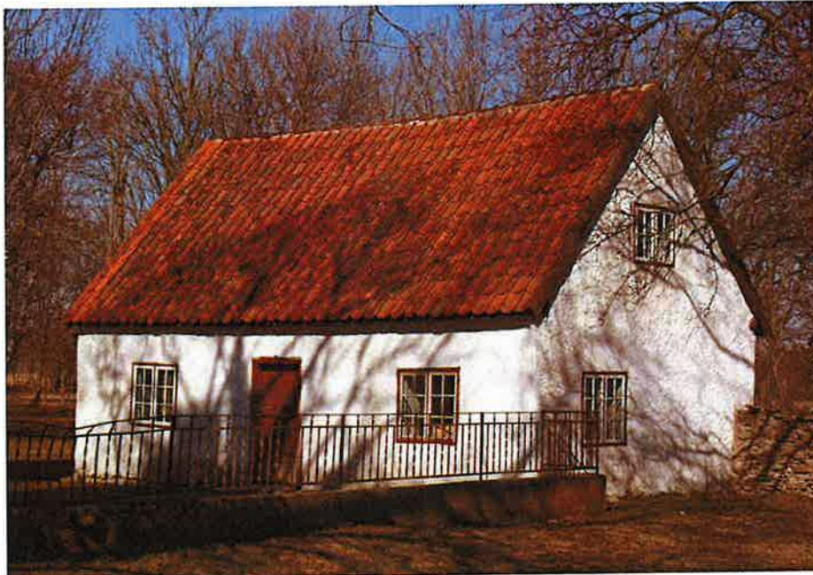
Norra flygeln, från storgården. I förgrunden syns smidesstaketet med dess gjutna sockel. Notera gavelfönstrets dragning mot hörnet, en typisk 1700-talsföreteelse.

Den norra flygeln , gårdens äldsta byggnad, har en s k ofullständig parstugeplan . Byggnaden härrör till stora delar sannolikt från 1700-talet. De hörn nära gavelfönstren pekar på detta. Bottenvåningen består av farstu och två rum, med varsin eldstad. I det östra rummet finns en mörkgrön kakelugn från 1920-talet. I det västra finns en vitputsad öppen spis, med sandstensomfattning. I omfattningen finns årtal 1781 inristat samt stram, geometrisk blomsterdekor. På vinden finns en sommarkammare som tidigare haft en kamin.