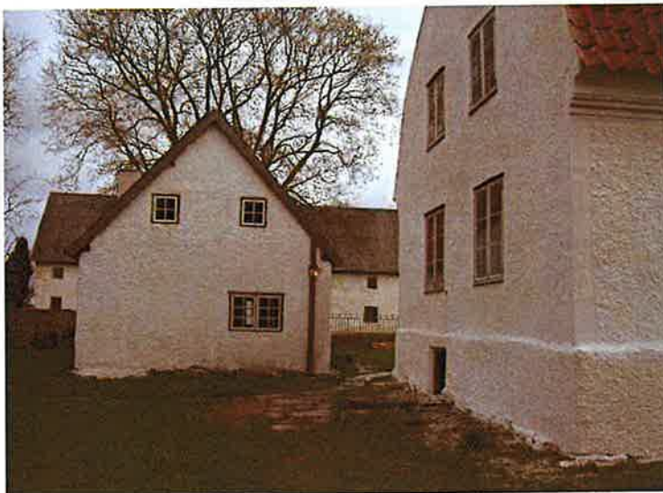
Norra flygeln, från väster.

Taket och fasaden har restaurerats på 1990-talet.