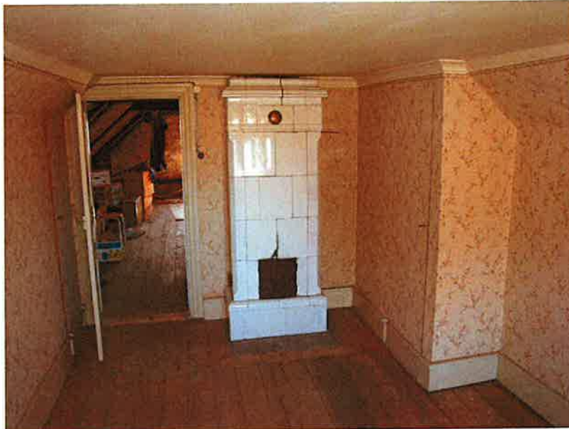
Pigkammaren i södra flygeln