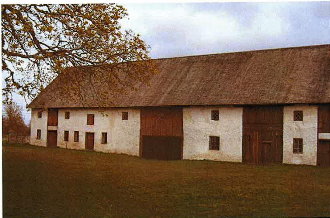
Norra fähusdelen, tröskvandringen och ladan.

Hela byggnaden är mycket välbevarad, med bibehållet murverk, oförändrad fasad, dörr- och fönstersättning, inredning och funktionsindelning, varsamt restaurerat till ursprungligt skick.