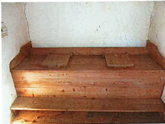
Herrskapsdassets välbevarade interiör

Fasaden är spritputsad. I öster är byggnaden sammanbyggd med stenvuren.