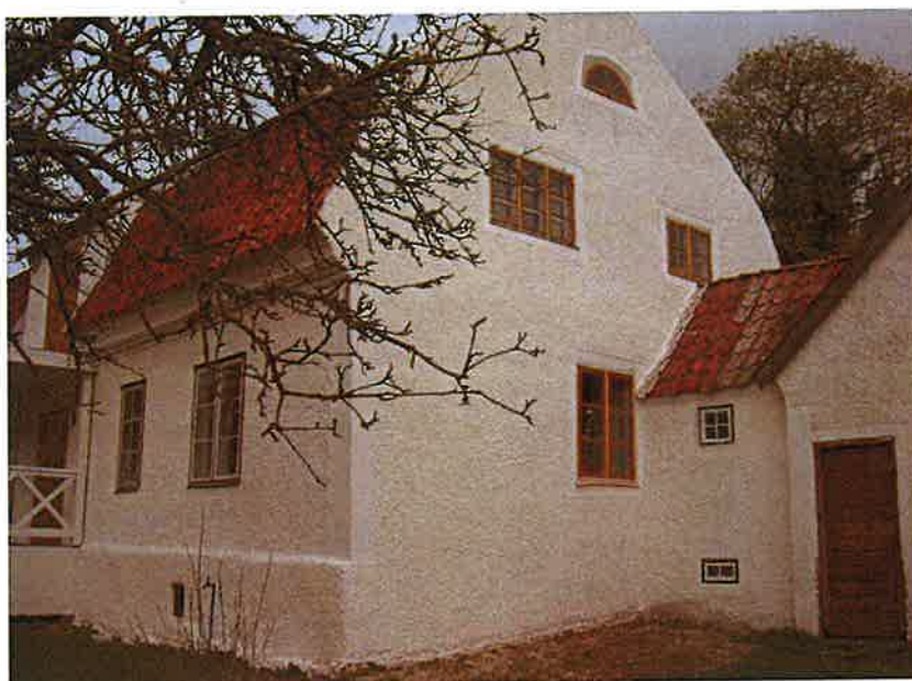
Manbyggnadens södra gavel och passagen till södra flygeln.

Byggnaden uppfördes ca 1840, delvis på gammal grund. 1924-25 förlängdes flygeln och sammanfogades med manbyggnaden för att bli mer "herrgårdslig". Nybygget inreddes med ett kök och serveringsutrymme. Från köket leder en serveringsgång in till manbyggnaden. Bakom köket finns ett ursprungligt badrum med torrtoa. På vinden anordnades en pigkammare i den västra, nybyggda delen. Idag fungerar det f d brygghusutrymmet som enkel snickarbod.