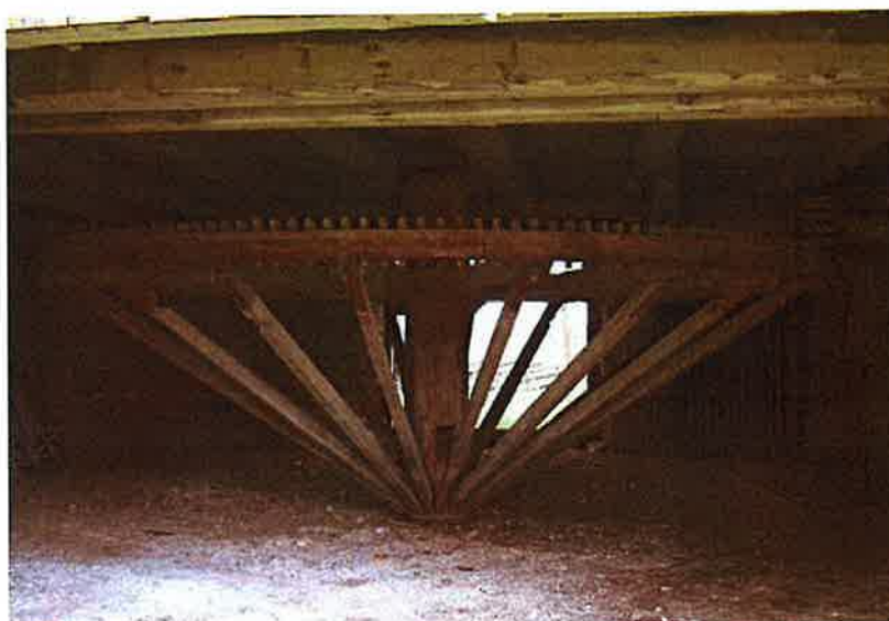
Tröskvandringen är en av de yppersta i sitt slag med en stor del av konstruktionen bevarad, såsom driv- och kuggjul i flera träslag.

Invändigt finns större delen av inredningen bevarad. Ko- och svinhusfunktionerna avgränsas med en buhvägg .