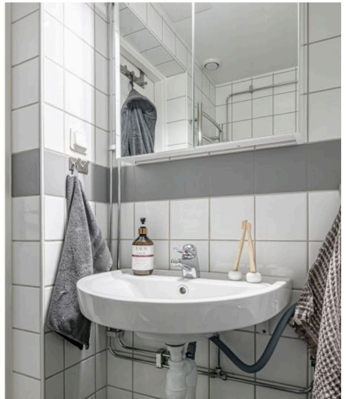
Fräscht duschrum med kaklade väggar, våtrumsmatta, toalett, handfat, spegelskåp, tvättmaskin och dusch.